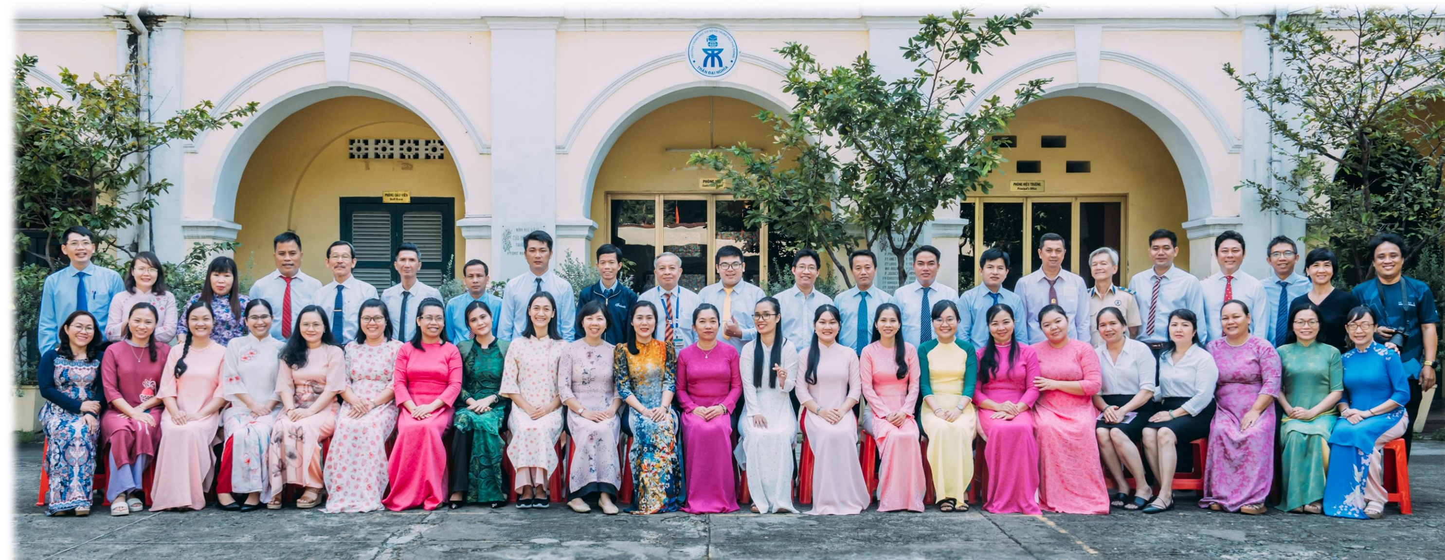
Đội ngũ Chất lượng * Tận tâm * Trách nhiệm